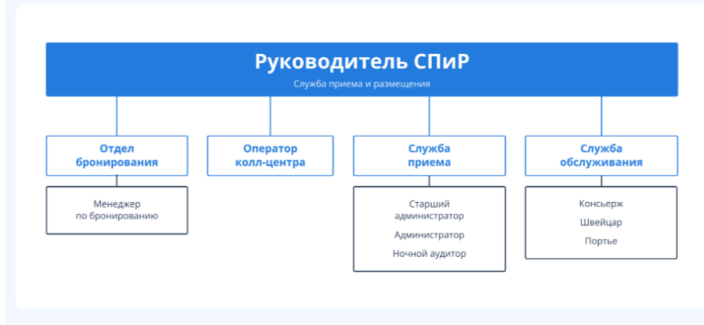
Структура отдела приема и размещения в гостинице